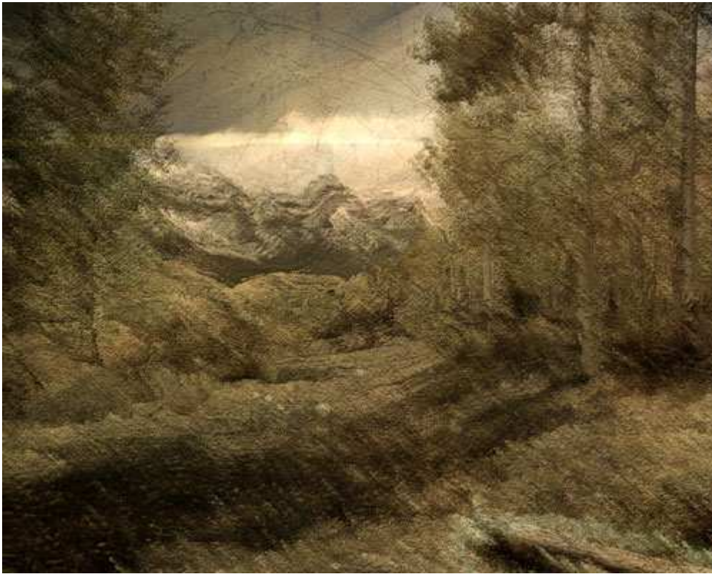
Filtre Aquarelle :