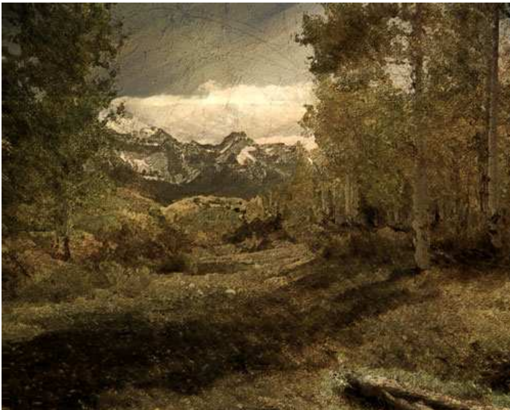
Filtre Contours lumineux :