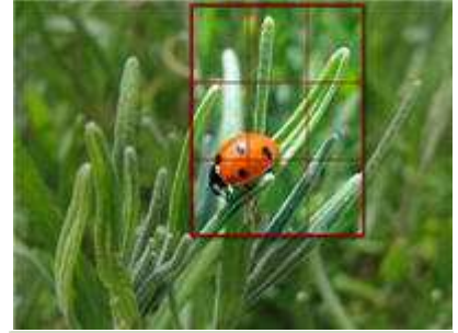
Suggestion de cadrage avec application de la règle des tiers.

Le respect de la règle des tiers ajoutera un certain dynamisme à vos images. Elle consiste à diviser mentalement l'image en trois bandes horizontales et trois bandes verticales, ce qui donne quatre intersections. Placer les éléments principaux de votre image sur ces points permettra d'ajouter du dynamisme à celle-ci. De cette façon vous éviterez de trop centrer le sujet. Les yeux étant la partie la plus vivante du visage, c'est sûr eux qu'il est préférable d'opérer la mise au point. Si vous ne photographiez que le visage d'une personne, placez les yeux au niveau des points d'intersection supérieurs. Si vous photographiez une personne de profil ou de trois quarts, laissez un espace vide dans la direction de son regard, pour suggérer et souligner celui-ci. Suivre ces règles de composition vous garantit une certaine efficacité. Vous ne devriez les enfreindre qu'une fois que vous les maîtriserez, dans des cas où une composition particulière sera justifiée.