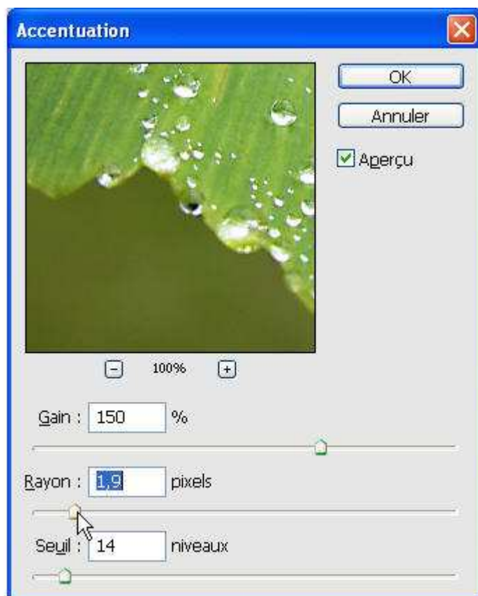
Le rayon doit être réglé entre 1 et 2 pixels.

A vous de jouer avec le curseur pour trouver la position qui permettra de faire ressortir des détails, sans pour autant que l'application du filtre soit détectable