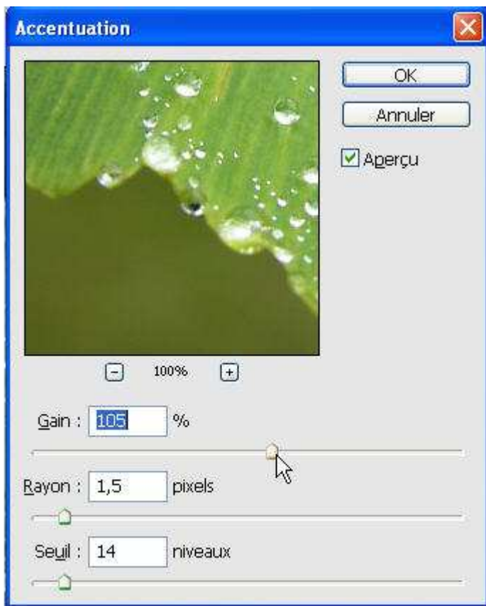
Le gain doit être placé entre 50 et 150 %