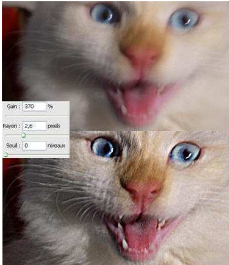
En haut, l'image originale. En bas, des réglages très excessifs.