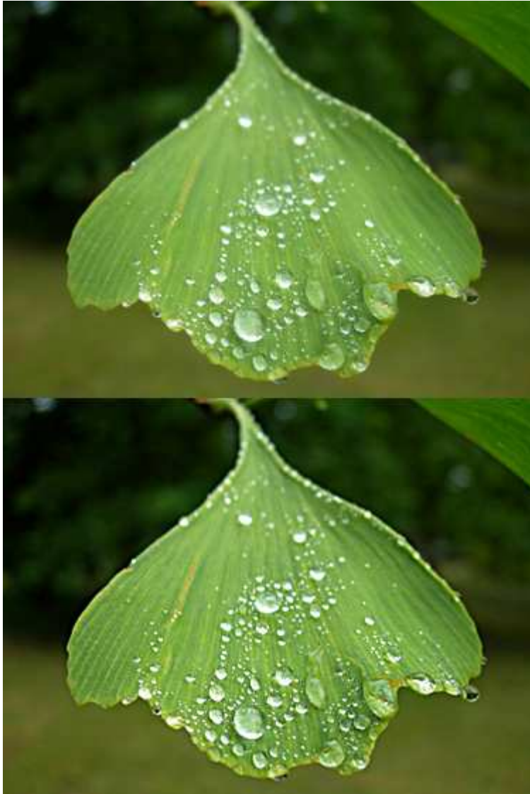
Avant (en haut) et après (en bas). Subtil, non ?